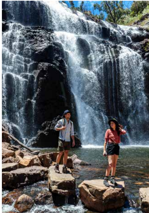
Mackenzie Falls courtesy of Parks Victoria.

南グランピアンズを訪れますか？ハミルトン地域は、ワノン川にあるワノン滝とニグレッタ滝の2つの滝へ向かう拠点です。